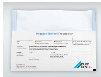
Hygopac Sealcheck, daglig test af svejsesømmen