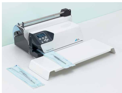
Instrumentbord og Hygofol-station til bordopstilling

Forsegling med system: Med tilbehøret og emballagefolierne fra Hygopac-systemet klarer du arbejdet i en håndevending. Den daglige test af svejsesømmen Hygopac Sealcheck gør det muligt at udføre en daglig kontrol af svejsesømmens kvalitet med et enkelt blik, hvilket er med til øge sikkerheden yderligere.